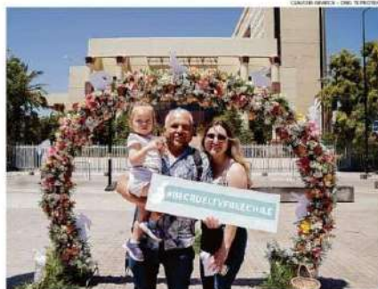
CAMPAÑA DE SENSIBILIZACIÓN SE LLEVÓ A CABO EN EL CONGRESO NACIONAL EL MARTES PASADO.