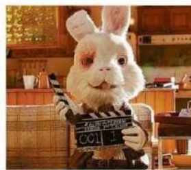
CORTOMETRAJE "SAVE RALPH" CAUSÓ CONVICCIÓN EN 2021.